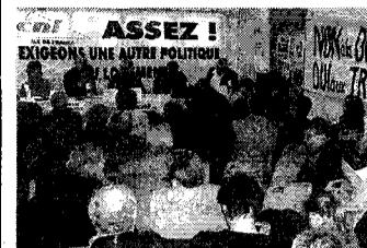
Plus de 70 personnes au forum.

C'est dans une petite salle prêtée par une amicale, à l'étroit, que la CNL 95 a tenu son forum, samedi 2 février. 75 personnes ont débattu pendant 4 heures des problématiques du logement : ANRU, marchandisation du logement, loi DALO (droit au logement opposable).